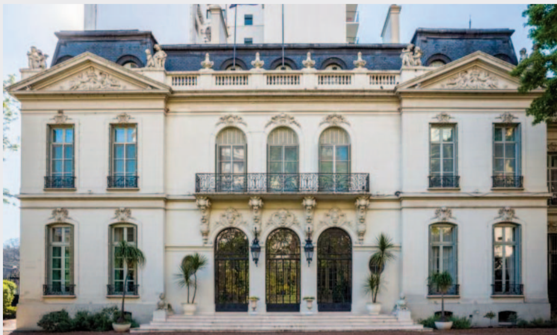
Ambasciata d'Italia a Buenos Aires